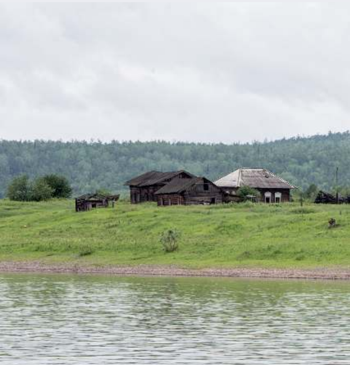
Храм святителя Иннокентия Иркутского в Мутино. Миссионерская поездка по Нижней Лене.