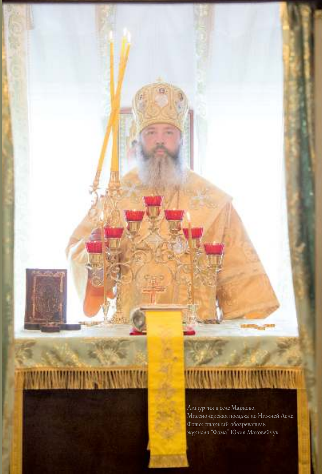
Литургия в селе Марково. Миссионерская поездка по Нижней Лене.